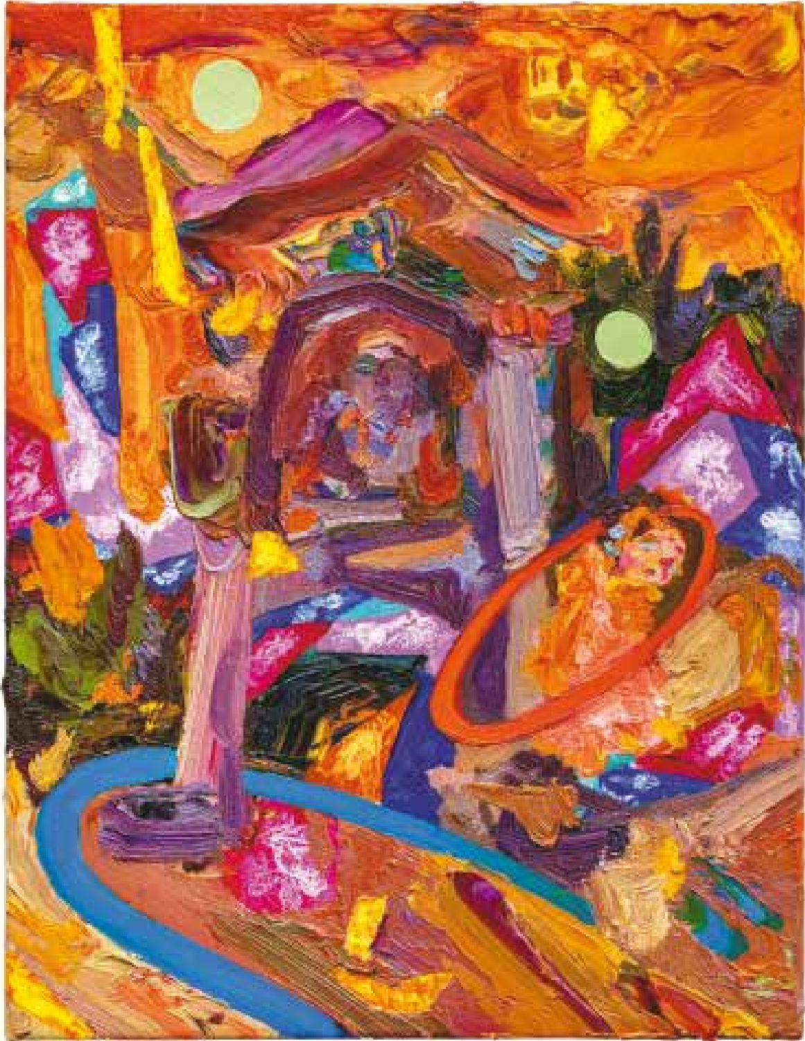
Crépuscule - 2020 - Huile sur toile - 35×27 cm - Collection privée, France