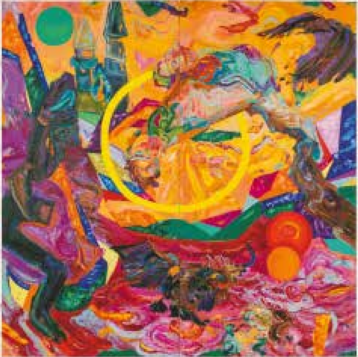
Les songes agitant mers et lumières - 2020 - Huile sur toile - 300×300 cm - Collection privée