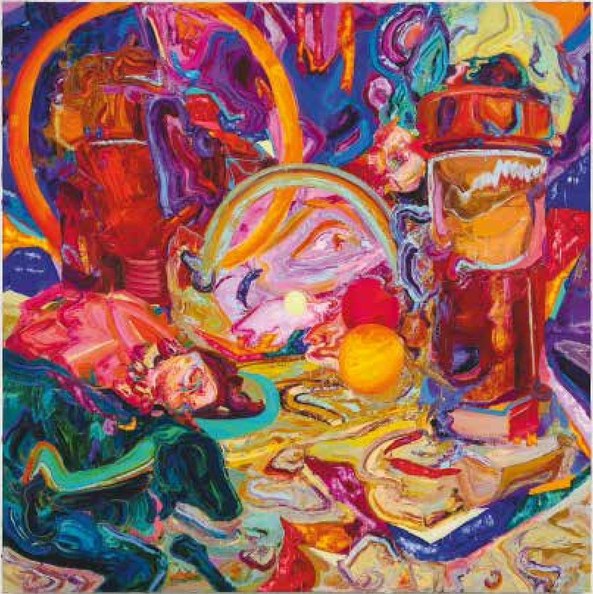
En couverture : Soupir des lueurs - 2020 - Huile sur toile - 250×200 cm - Courtesy Art : Concept, Paris, France Ci-dessus : La proie du soleil - 2020 - Huile sur toile - 250×250 cm - Collection privée New York, USA