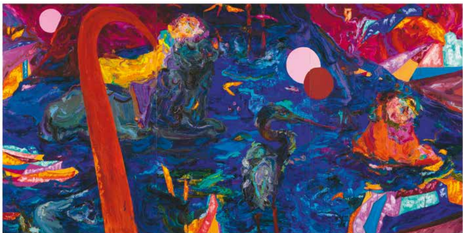
Un ciel volé - 2020 - Huile sur toile - Triptyque, 195×390 cm - Collection FRAC Auvergne, Clermont-Ferrand, France