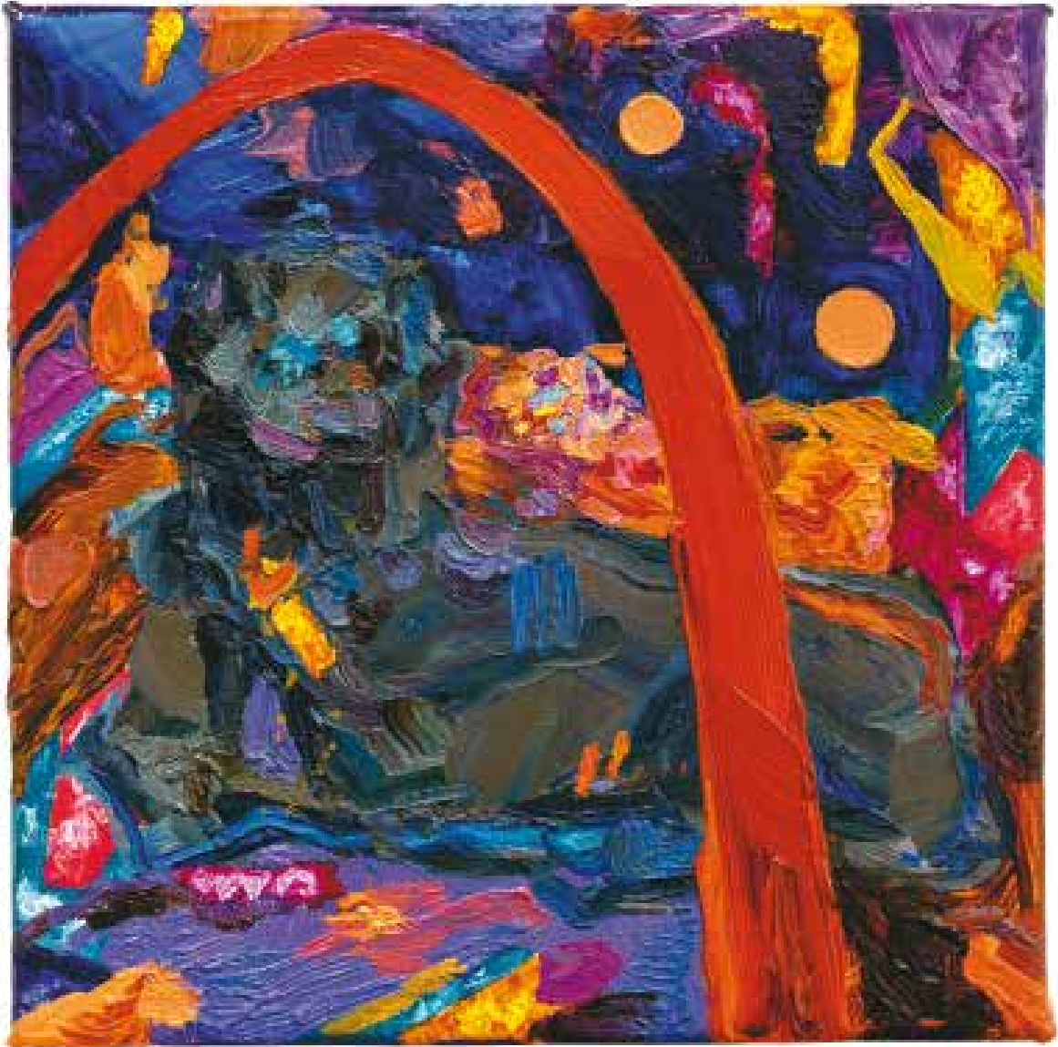
Hibernation I - 2020 - Huile sur toile - 20×20 cm - Collection Adrien Saporito, Paris, France